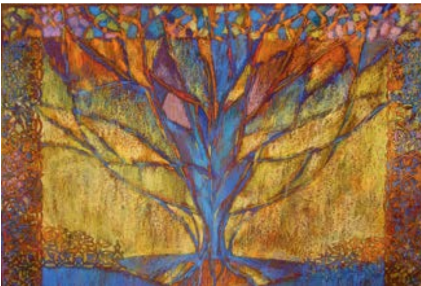
«Цветение». Лист 2