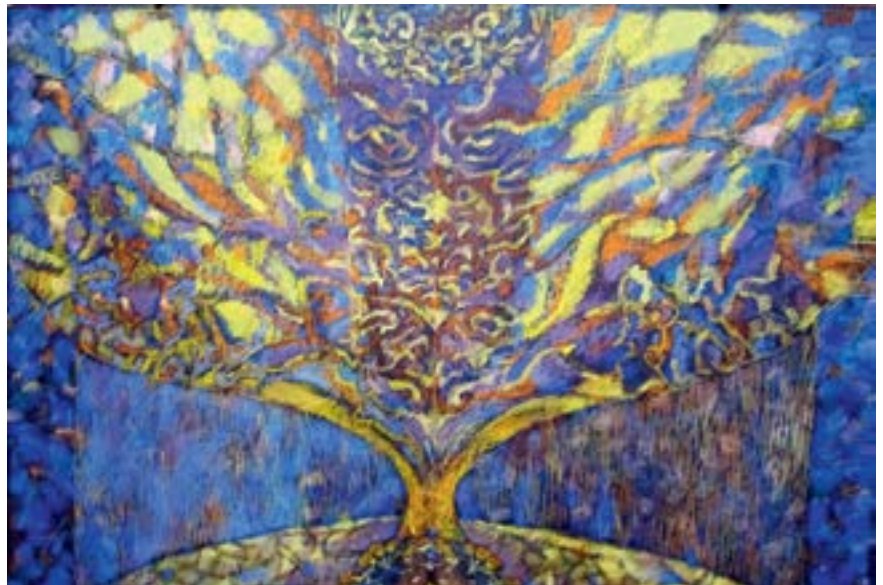
«Цветение». Лист 1

Знакомство с католическими храмами Германии – ве-