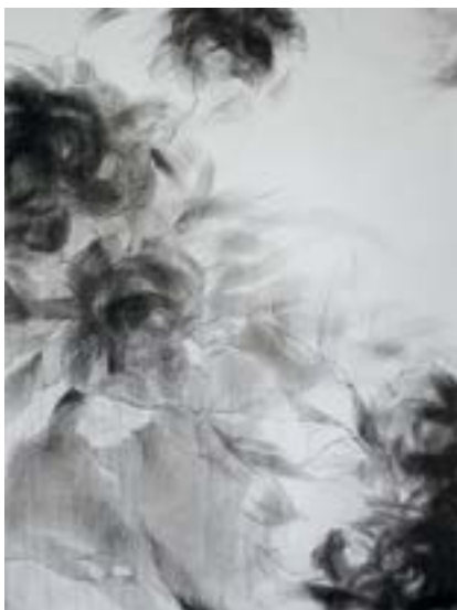
«Танец цветов». Лист 2

ла материал, верно использовала фактурную основу бумаги, умело соединила знания и опыт, а главное – слушала свое сердце. Магия свершается сразу – одновременно насыщенное и свободное пространство композиций втягивает тебя; в нем ощущаешь и парение воздуха, и слабое колебание форм, и густой аромат цветения; тональные переходы завораживают, а в мягких, тающих, полупрозрачных формах, гармонично рассеянных то тут, то там, так и хочется остаться. Что еще нужно для наслаждения искусством?