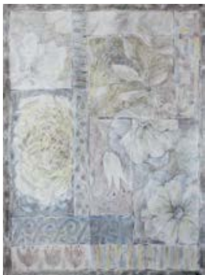
«Сад. Пробуждение». Лист 1

соборов. Пронизанные идеей космизма, эти произведения вмещают в себя хаос, из которого в центре рождается ядро, здесь это королева цветов – роза. Вместе с трехчастностью цвета, отталкиваясь от его символизма, постепенно погружаясь в оптически-иллюзорное пространство, приходим к другим триединствам: явь – навь – правь, рождение – бытие – смерть, утро – день – ночь.