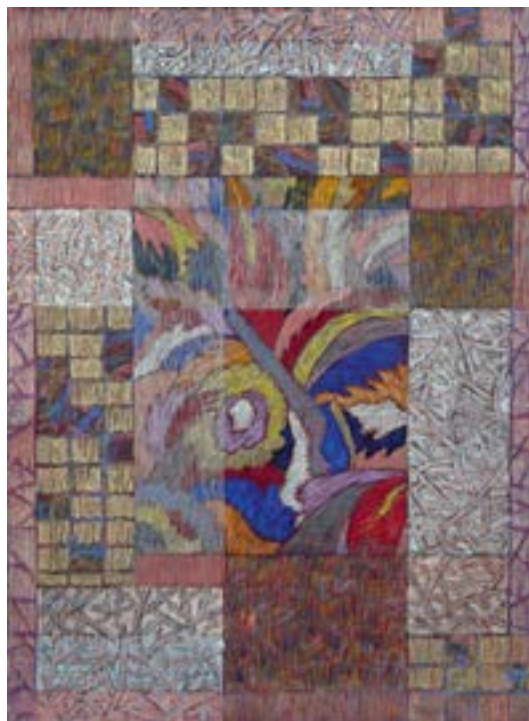
Лист из серии «Сад»

Источниками художественных фантазий для Чебаковой служат классическая и инструментальная музыка, литературные произведения, путешествия. Глубоко «вдыхая» новое, непривычное, непознанное, она буквально «выдыхает» свои произведения – изящные и тонкие, необремененные мудрствованиями, но с глубинными смыслами, исходящими от включенных в изображение извечных символов-знаков. Как правило, мысли автора не укладываются в одну композицию, поэтому появляются серии,