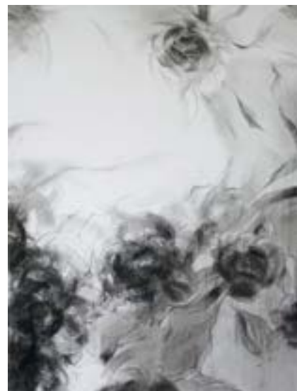
«Танец цветов». Лист 3