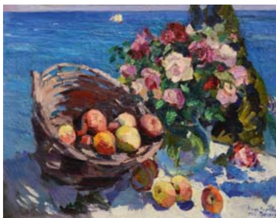
К. Коровин. «Гурзуф»

Трудно поверить, что такой полный силы и энергии холст написан в один из самых тяже-